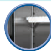
Grilles sur taquets (4 taquets par grille)